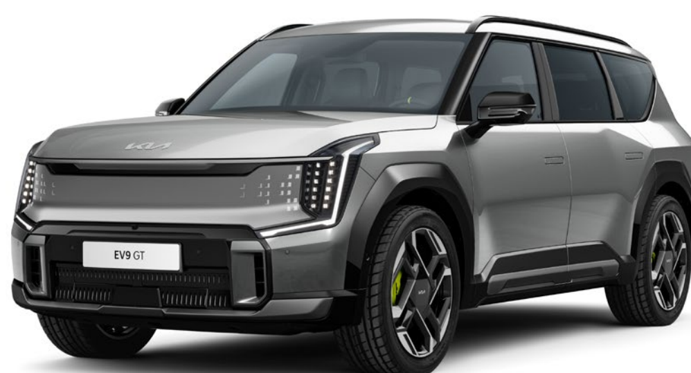
Pebble Grey (DFG)