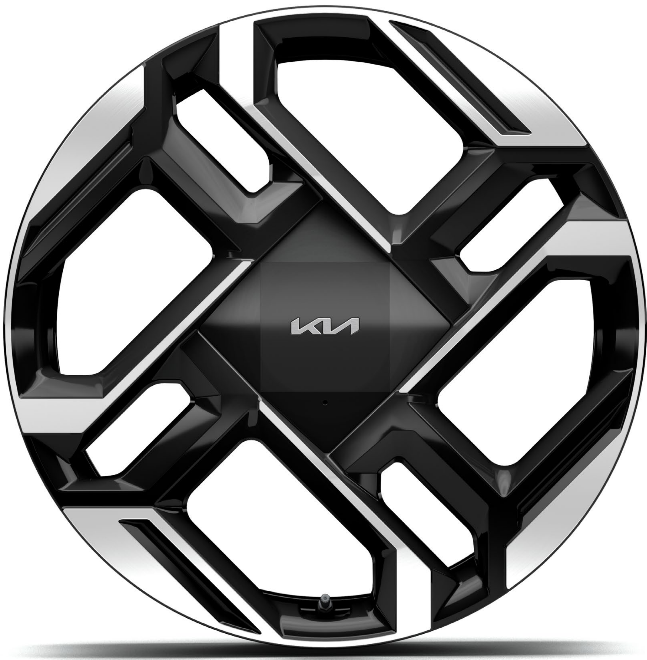
Cerchi in lega da 21" GT