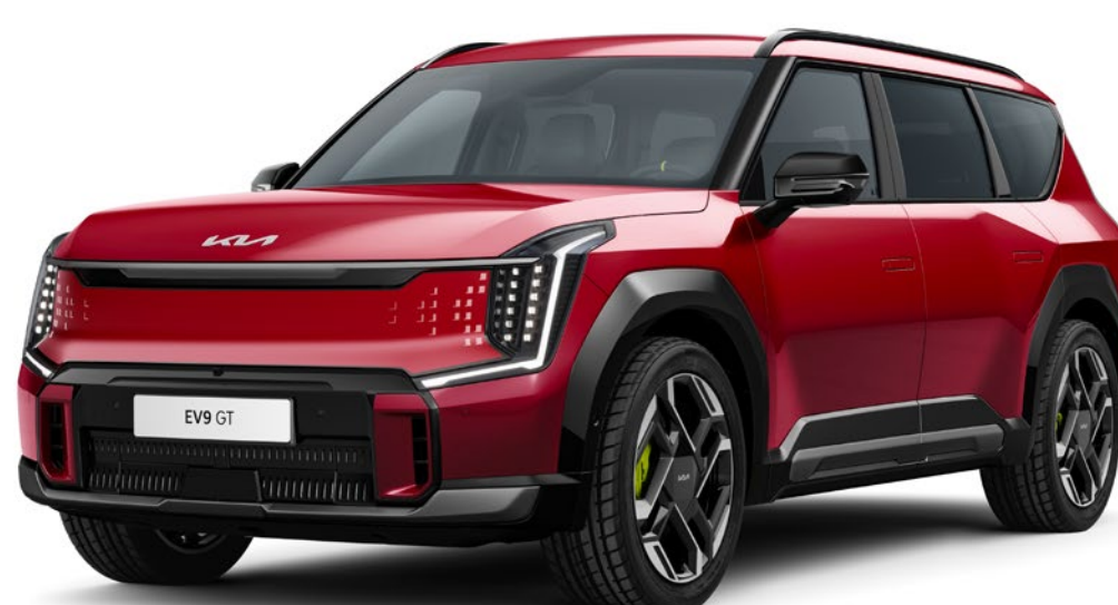
Flare Red (C7R)