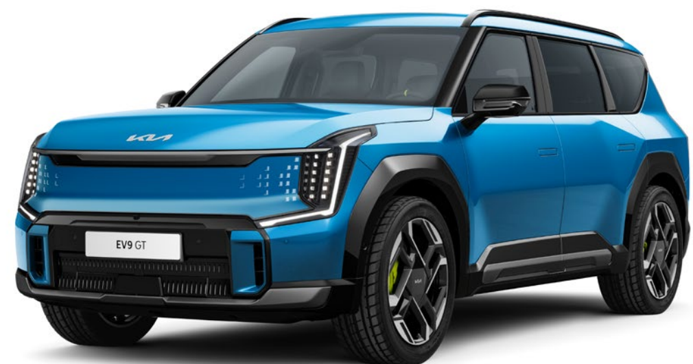
Ocean Blue Glossy (OBG)