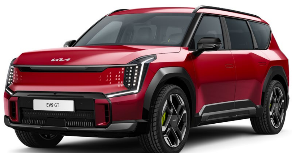
Flare Red (C7R)