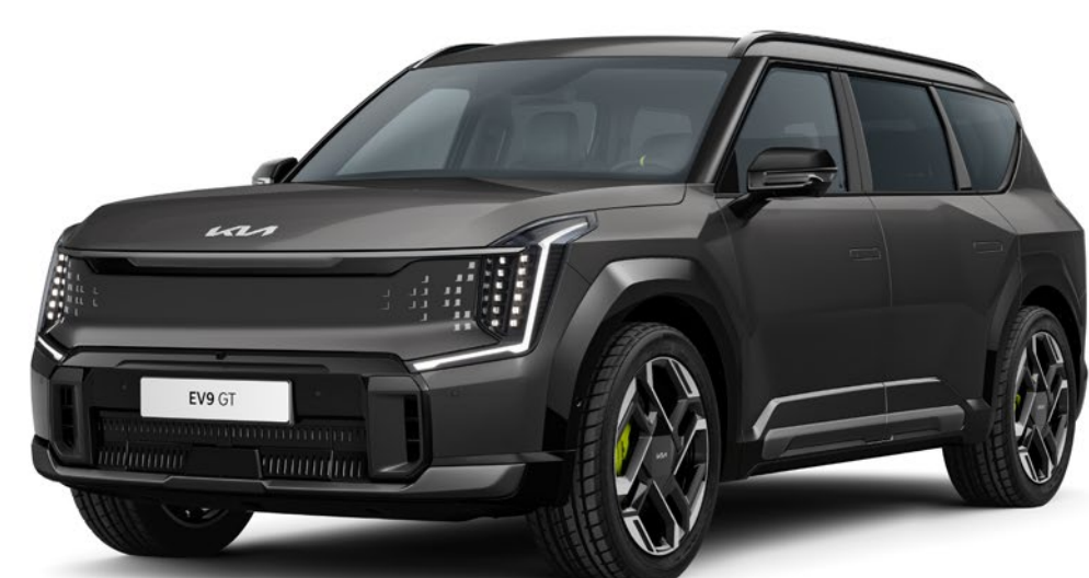
Panthera Metal Glossy (P2M)