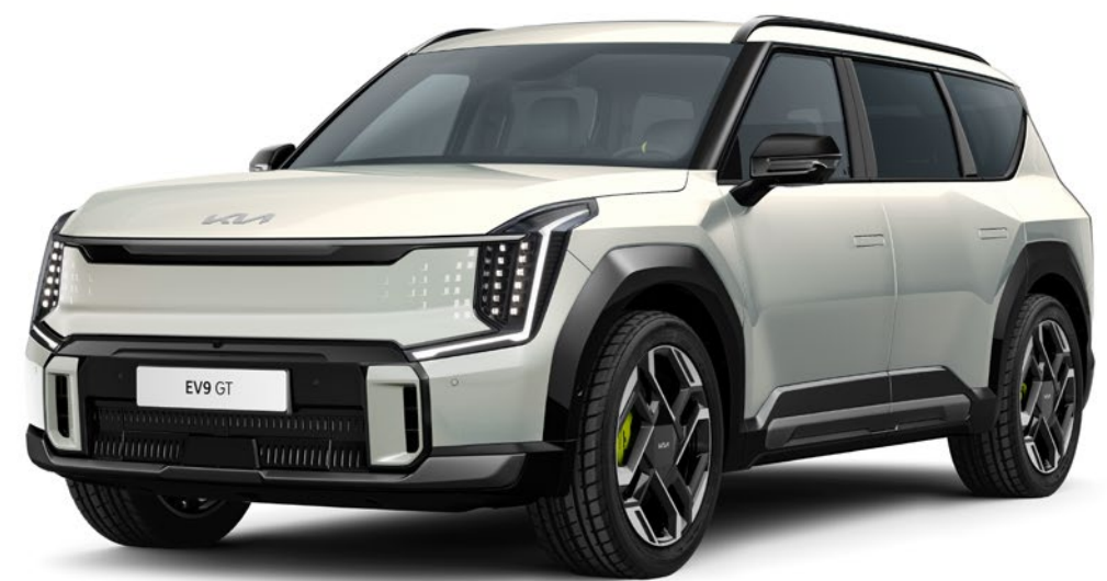
Ivory Silver Glossy (ISG)