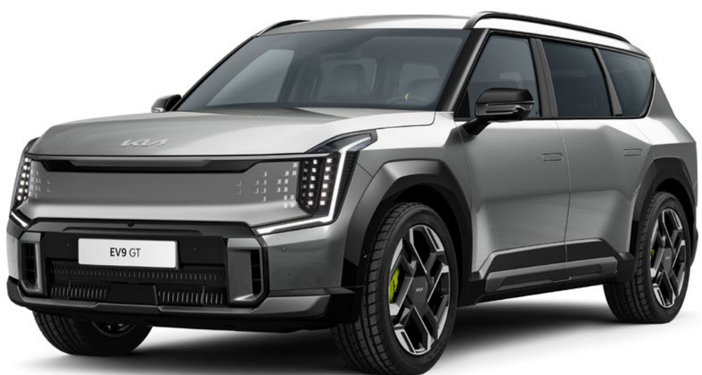
Pebble Grey (DFG)